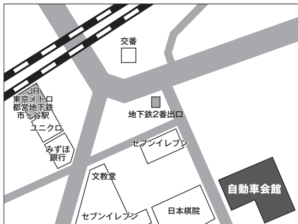
第1回会場 自動車会館(市ヶ谷)